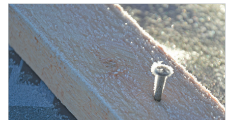
Winterpause! Viele Baustoffe können unter 5 °C nicht verarbeitet werden.